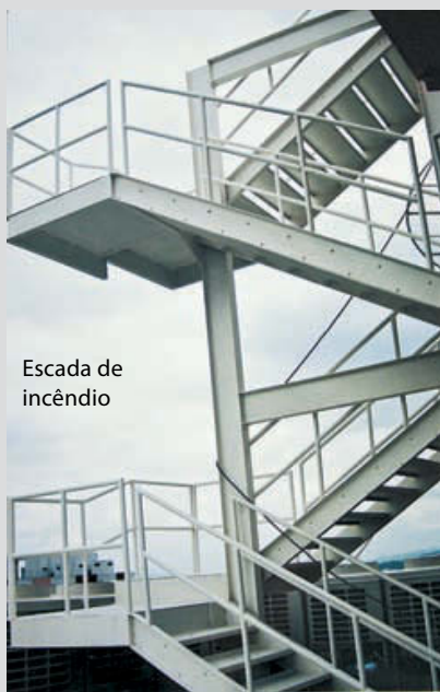
Escada de incêndio